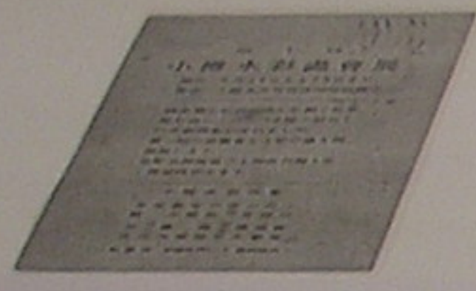
第1回小樽水彩画会展案内状 1948(昭和23)年

2000(平成12)年 ○第53回展 8月23日~27日(市立小樽美術館市民ギャラリー)、24名43点。 日本水彩画会理事長 大和屋巖賛助出品。