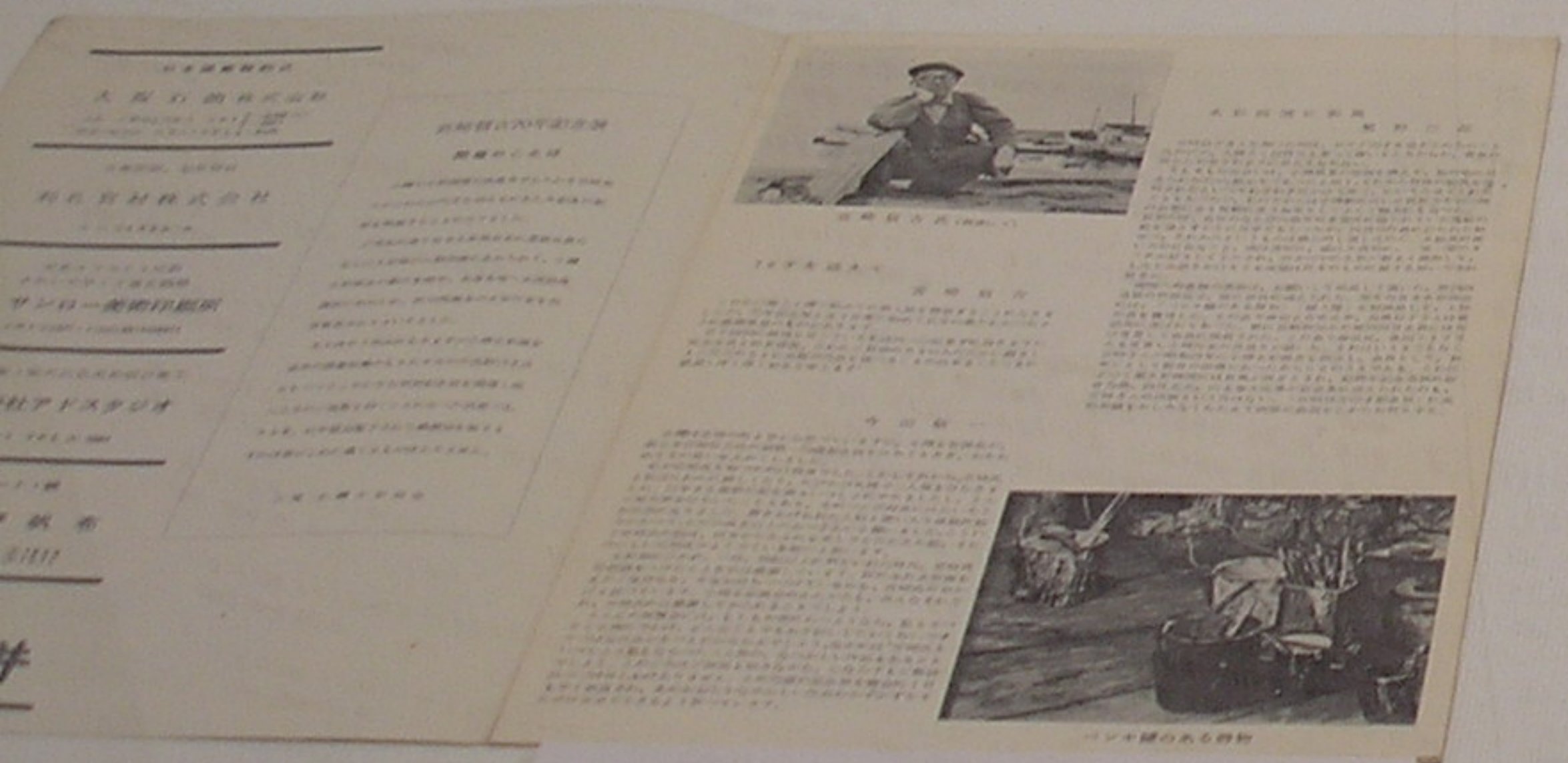
宮崎信吉70年記念展パンフレット 1966(昭和41)年 小樽丸井今井4期新ホール