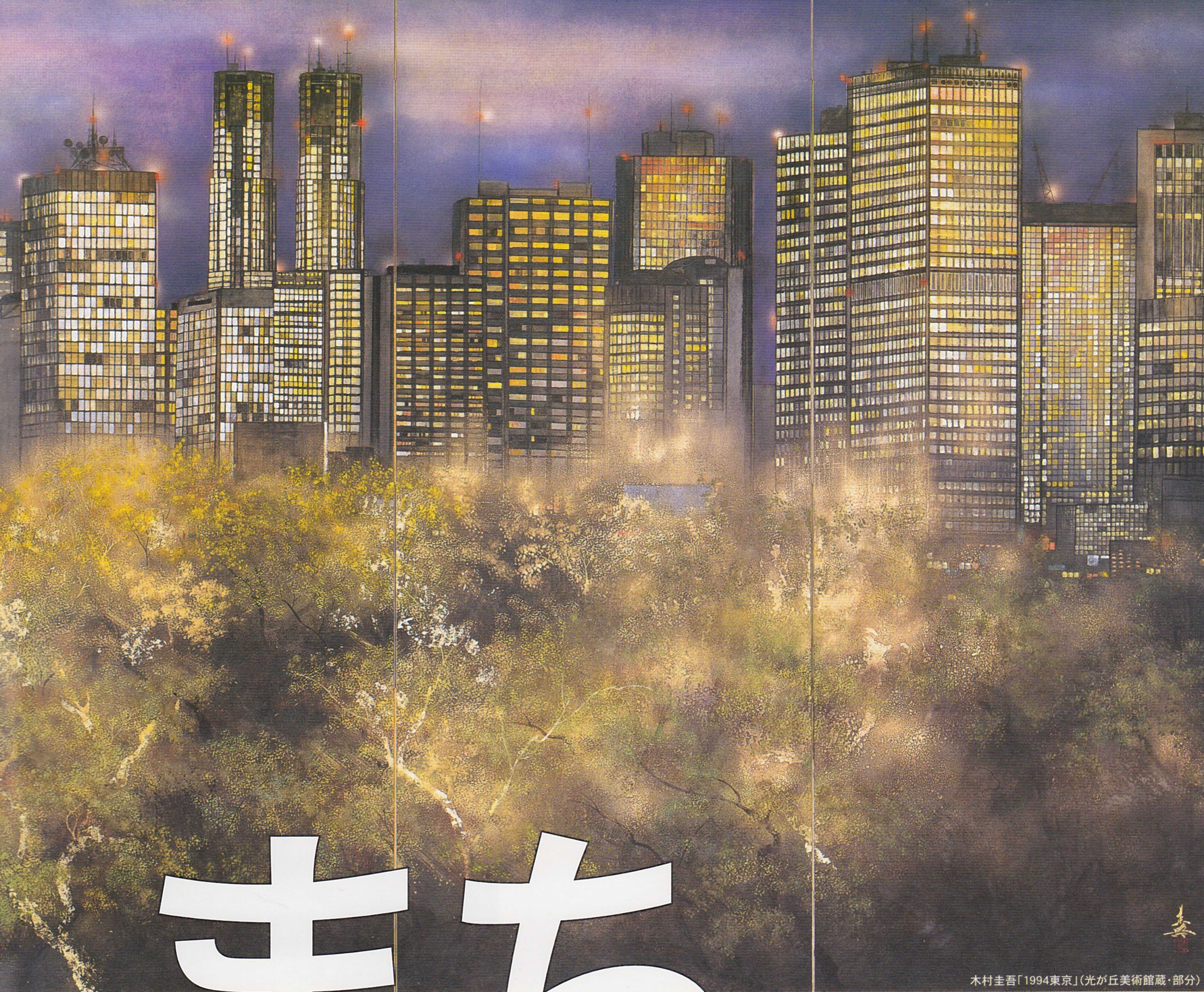
木村圭吾「1994東京」(光が丘美術館蔵・部分)