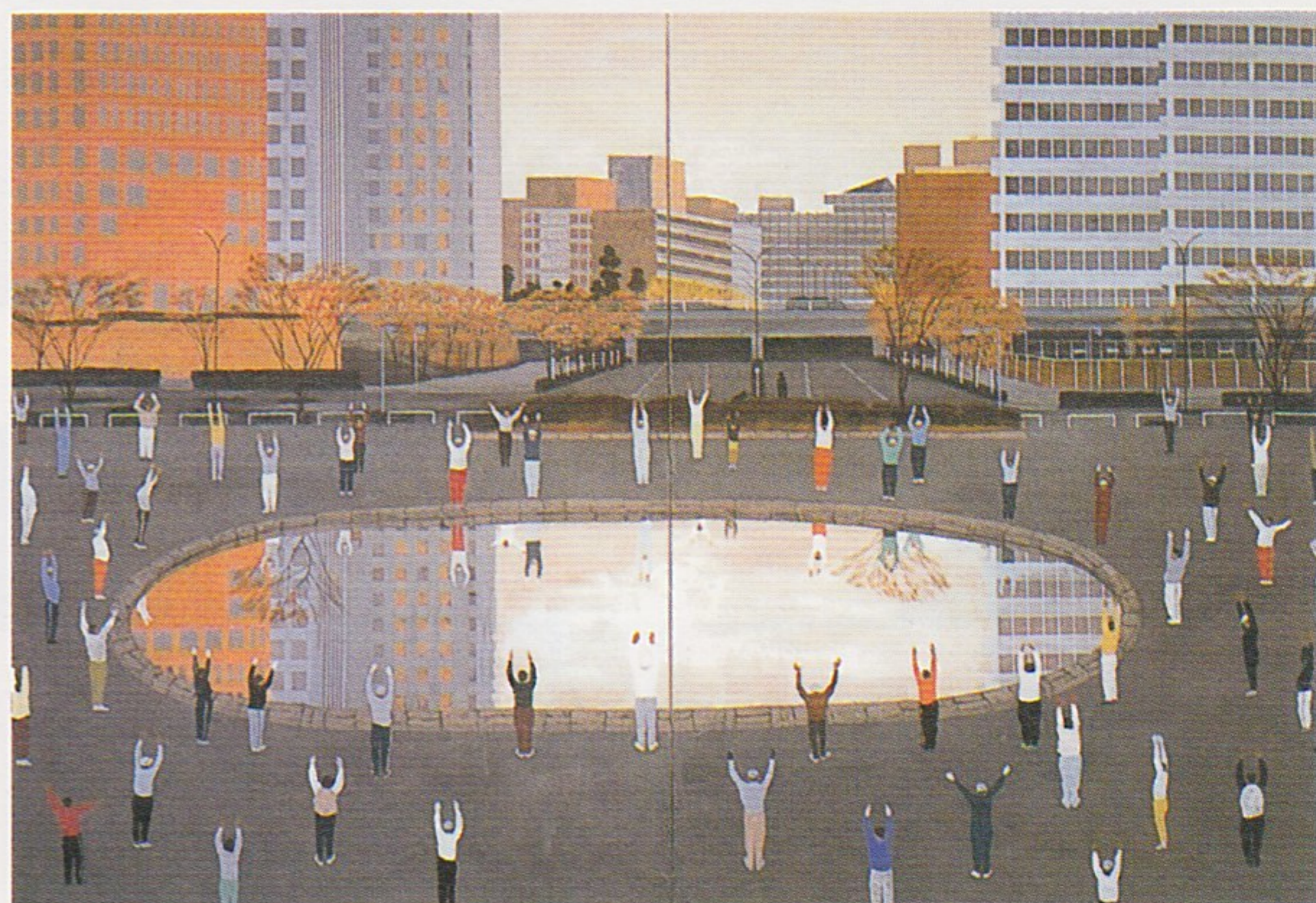
米谷清和「街・朝」(個人蔵)

交通 近鉄宇治山田駅・五十鈴川駅より徴古館経由の外宮内宮循環バスで徴古館前下車徒歩3分(『CANバス』ご利用なら徴古館前下車すぐ) 近鉄宇治山田駅よりタクシーにて5分 伊勢自動車道伊勢インターチェンジより約2km