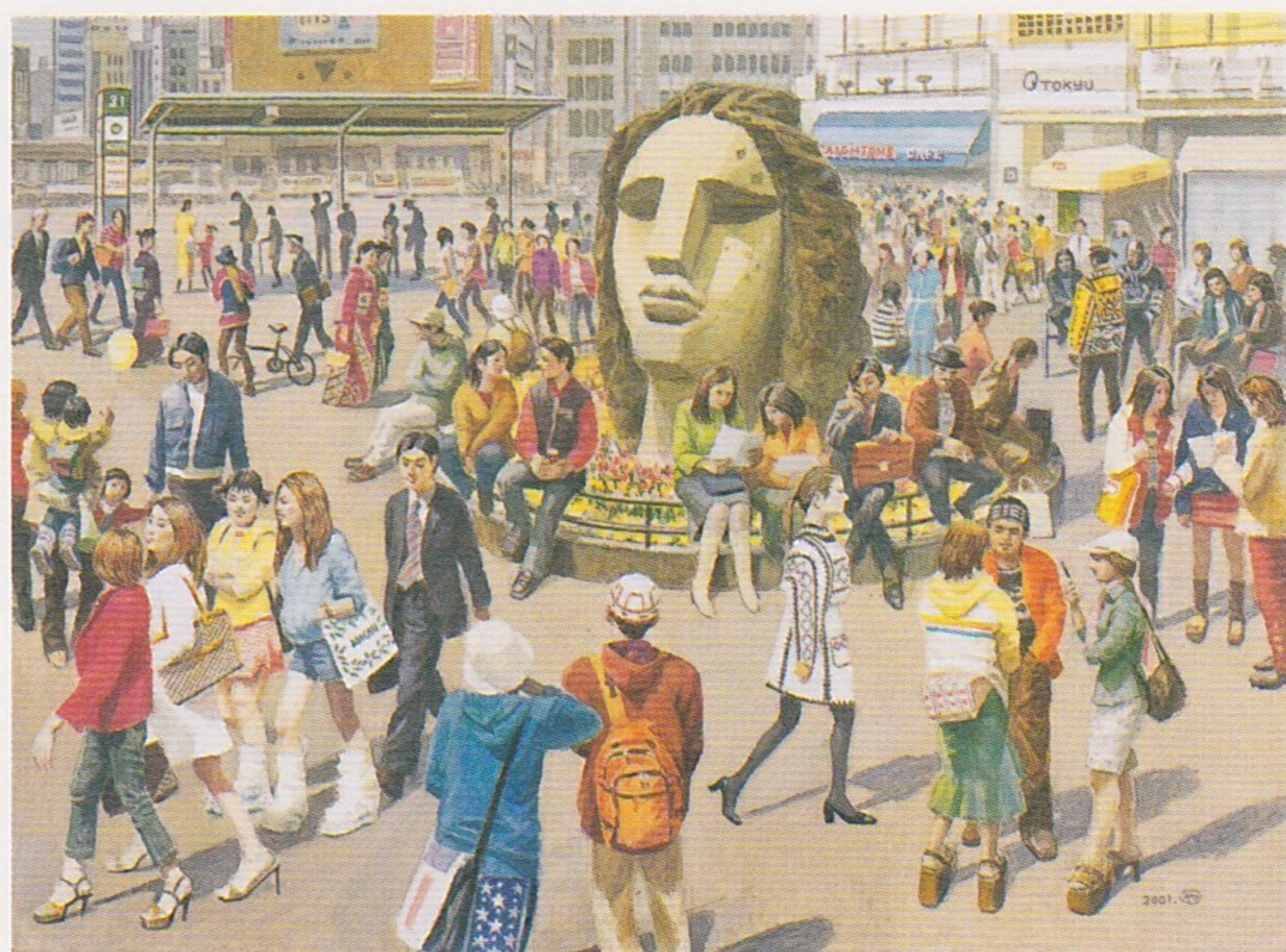
大和屋 巖「モヤイ像と人間模様」(個人蔵)